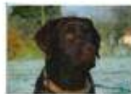
Indy le gentil, réformé adopté dans ma famille