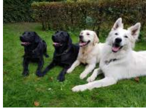
Neige, Ness, Otello, Oréo