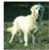
Eros le détenteur réformé adopté par un collègue