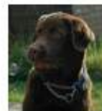
Glangko le beau réformé