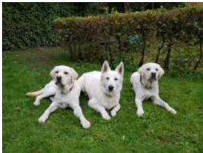
Néo, Nala, Newpi

Néo, Newpi, Ness, Neige, Nala, Otello, et Oreo ont été jugés aptes médicalement et ont commencé leur formation de chien guide. Vous aurez de leur nouvelles dans la prochaine newsletter.