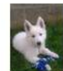
Nala l'énergique, en formation

Pour toutes ces raisons, Pax (ma dernière en cours) a 8 mois et dans 4 à 5 mois je suis prête pour le suivant !!!