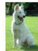
Koban « la classe » chien guide