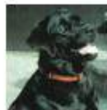
Floxy la joie de vivre chien guide