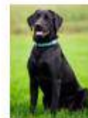
Marley le meilleur, chien d'assistance