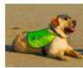
Leticia le chouchoo, réformé adopté par des connaissances