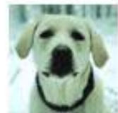
Gwen la pleurnicheuse, chien guide retraité